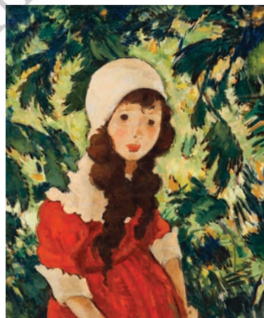
Nicolae Tonitza, Fata pădurarului

Într-o zi, pe când vara se instalase confortabil, Ana, fetița cochetă cu păr bălai, nas cârn și o aluniță pe obrazul stâng, s-a gândit să-i facă o surpriză prietenei sale, Artemis. S-a dus hotărâtă să culeagă flori suave precum chipul luminat și angelic al lui Artemis, de prin poienițele dumbrăvii de la marginea satului. Îmbrăcată în rochie nouă de culoarea fulgilor imaculați de nea, aceasta a țopăit din loc în loc adunând mănunchiuri de flori azurii de culoarea ochilor prietenei sale.